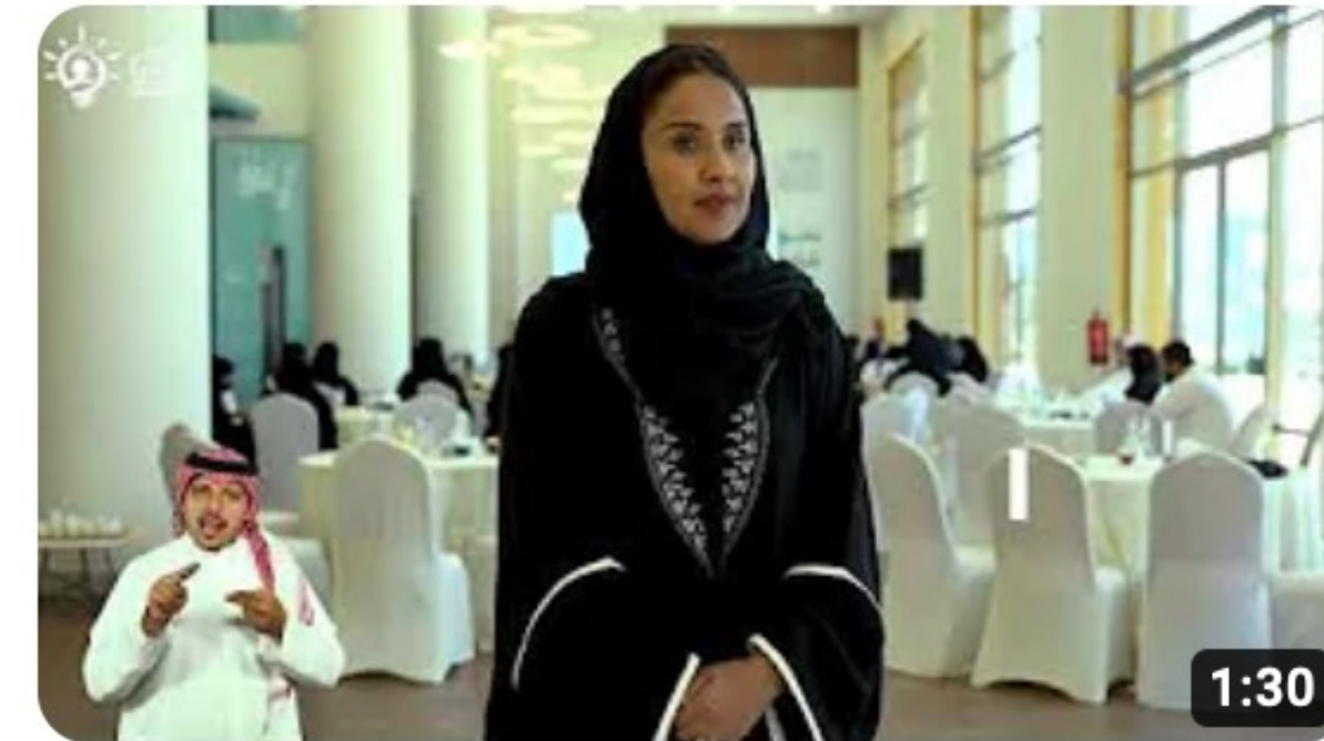
ورشة عمل (تعزيز جودة الخدمات المقدمة في مراكز الرعاية النهارية)