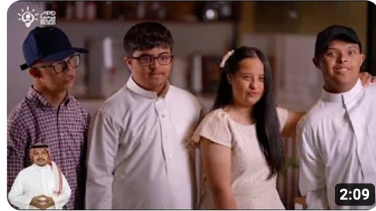
اليوم العالمي لمتلازمة داون