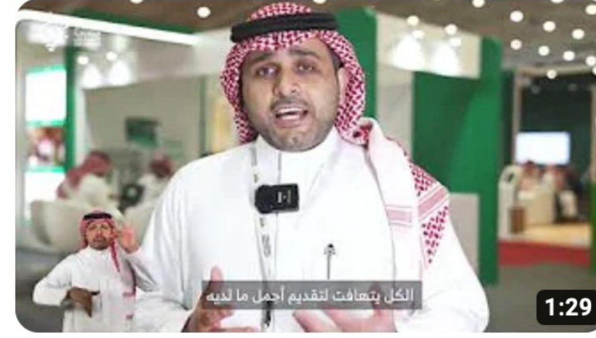
المعرض السعودي الدولي لمستلزمات الإعاقة والتأهيل