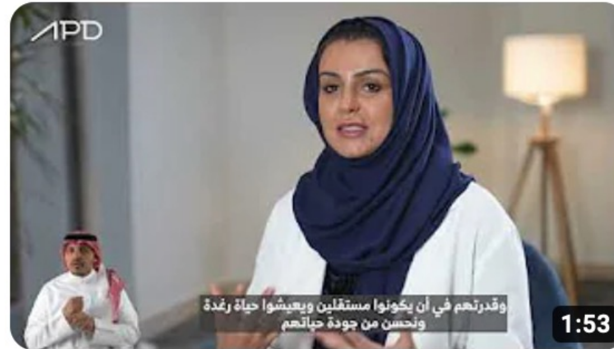
اليوم العالمي للتوحد