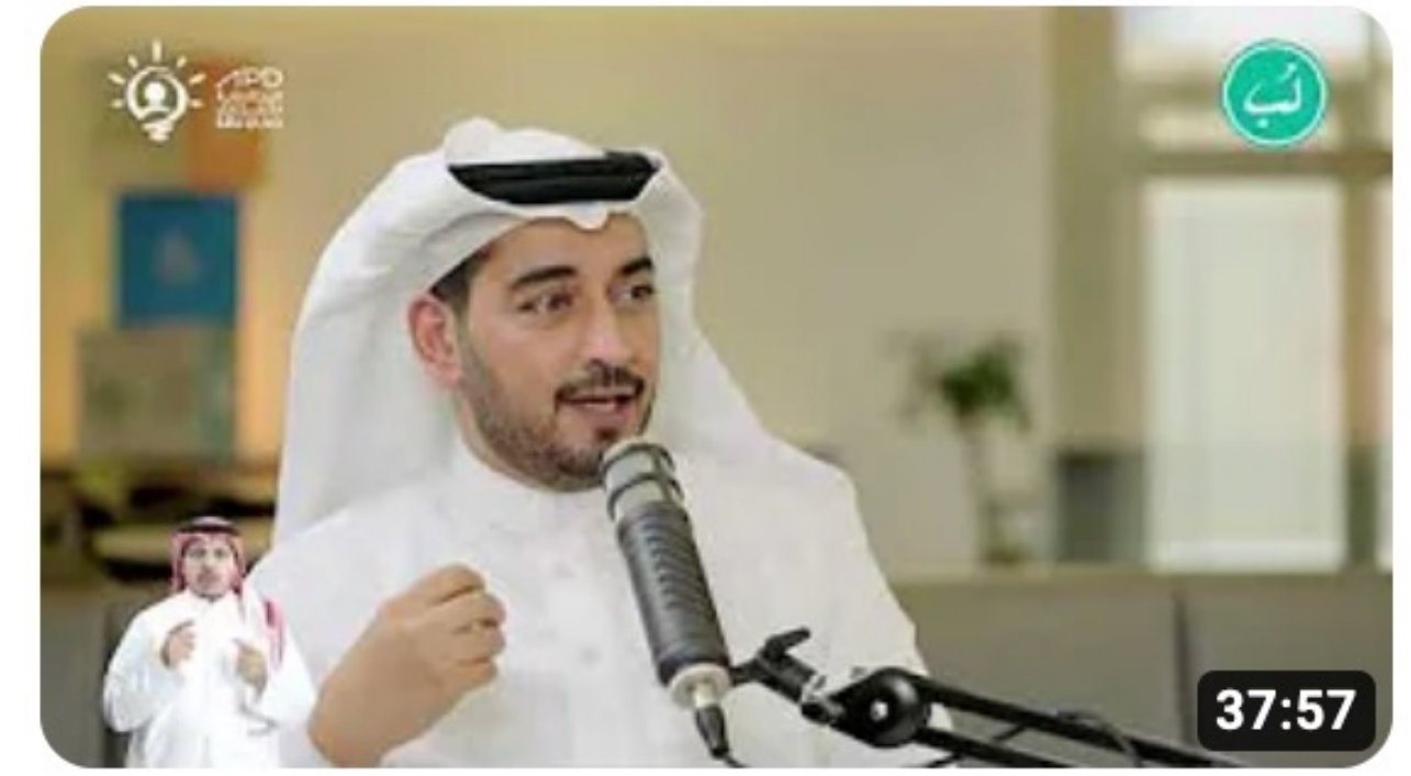
الصحة النفسية للأشخاص ذوي الإعاقة