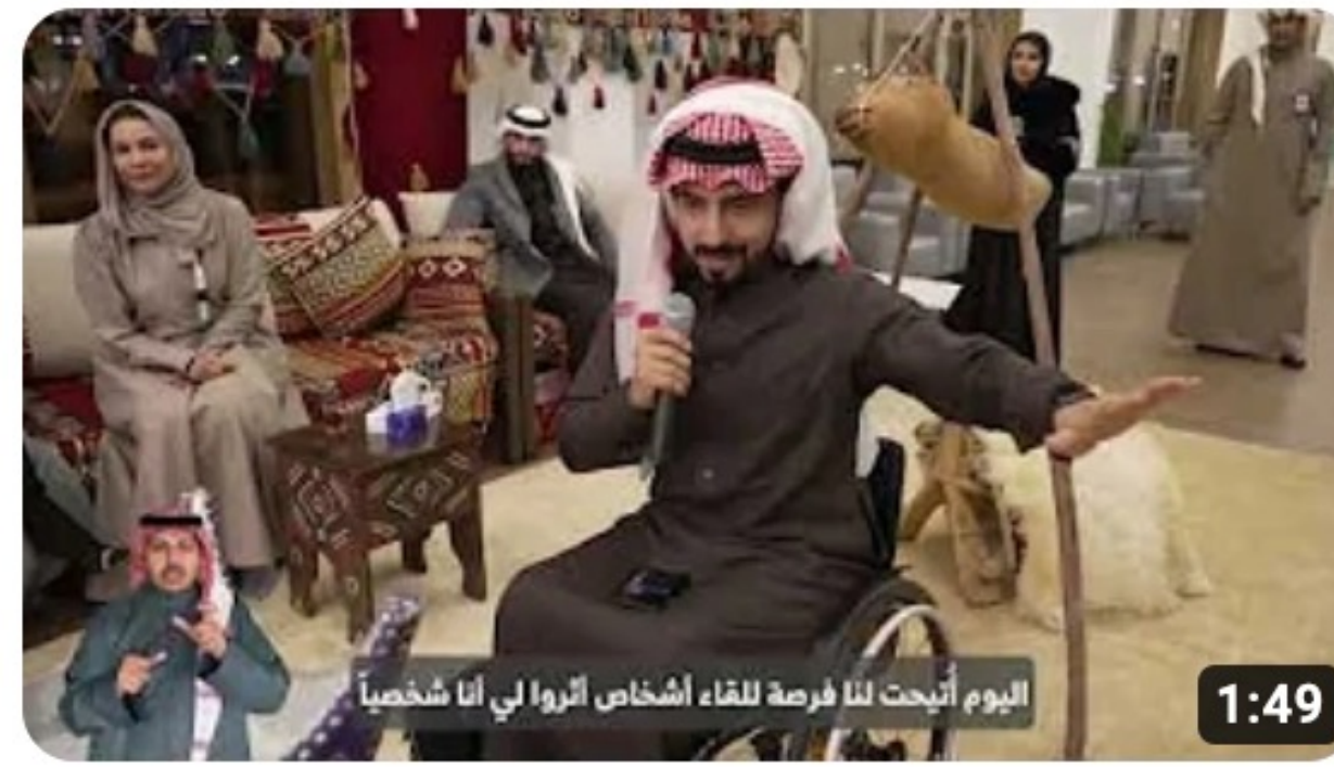
مجلسنا - الأنشطة الرياضية للأشخاص ذوي الإعاقة