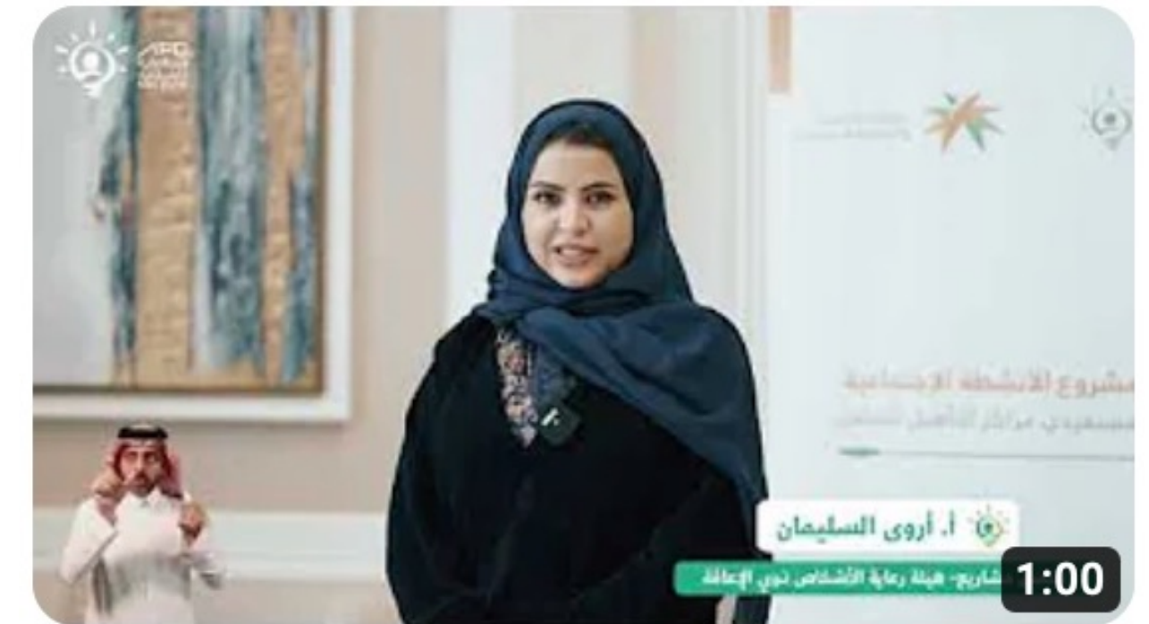
البرنامج التدريبي الثالث لمشروع الأنشطة الاجتماعية لمستفيدي مراكز التأهيل الشامل