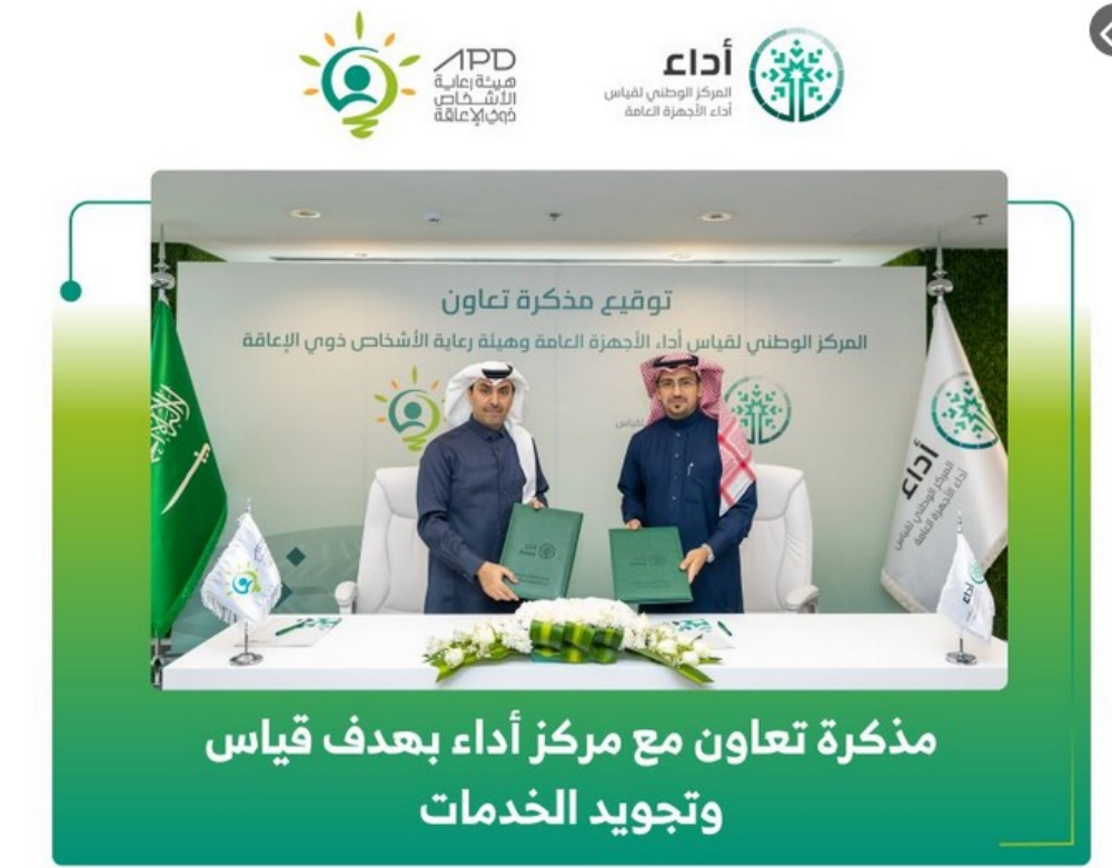
مذكرة تعاون مع مركز أداء بهدف قياس وتجويد الخدمات

#هيئة_رعاية_الأشخاص_ذوي_الإعاقة والمركز الوطني لقياس أداء الأجهزة العامة يوقعان مذكرة تعاون تهدف إلى قياس وتحسين وتجويد الخدمات