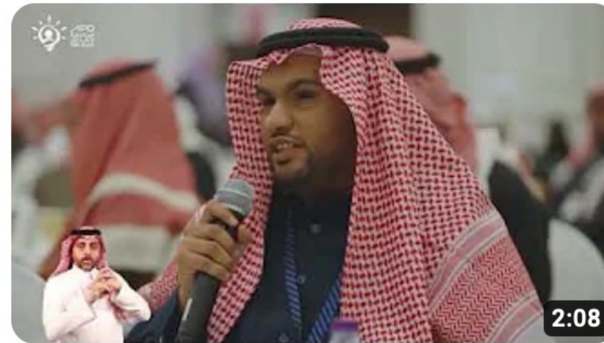
ملتقى فرص حقيقية لعمل مدعوم برنامج (مساعد الظل)